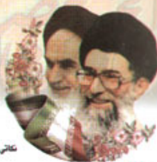
نگاشتی از امام زاهد (ره) و مقام معظم رهبری